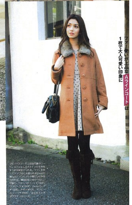
1枚で大人可愛い印象に ブラウスが上品なオンラインコート