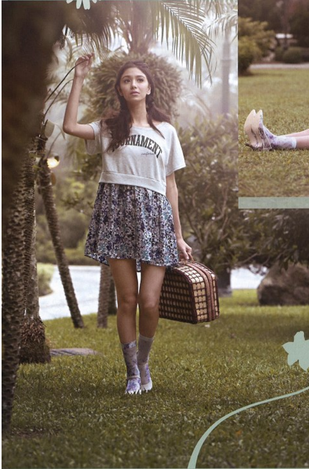
ESTACOT 灰色上衣連藍色碎花 one-piece $240 紫色繡碎花短褲 $49 杏色 wedges $320

MOUTHvalley 粉紫色羅漢士露膊上衣 $240 MOUTHvalley 黄 × 藍色花花圖案短褲 $240 藏藍色格仔蠟燭圖案手提揸袋 $240 Ka Rina 白色繡碎花圖案透明高跟鞋 $320