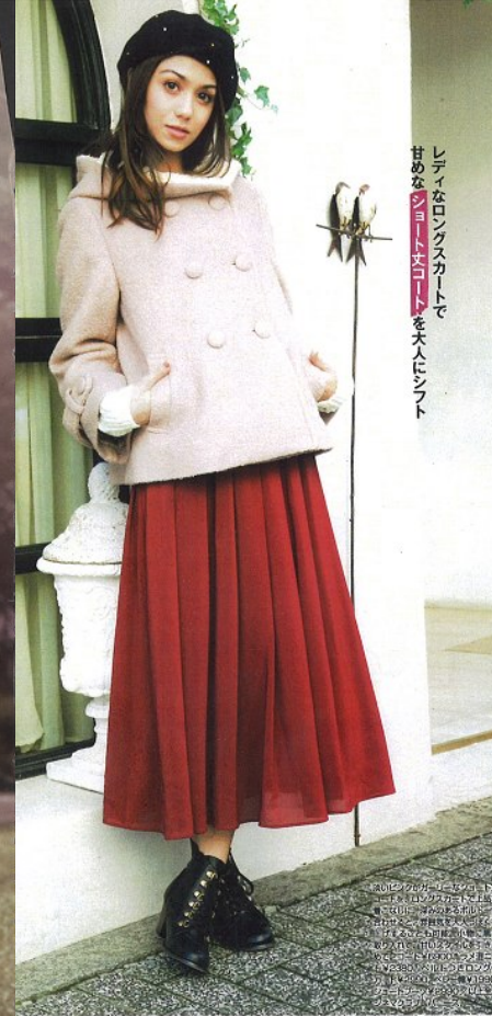
レディなロングスカートで 甘めなジャケットを大人にシフト