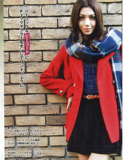
ベージュなジャケットに チェックマニエールをオンして秋冬にシフト