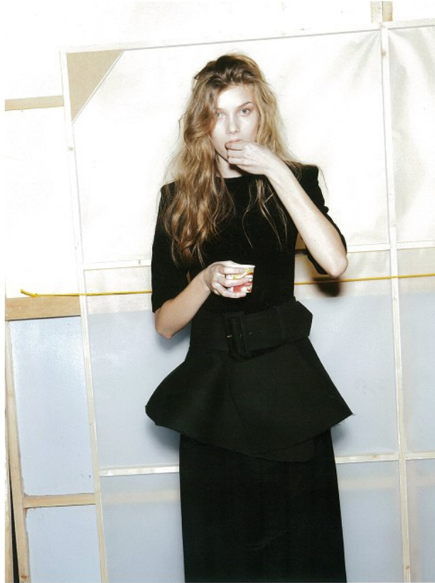
black round-neck top, flared wide belt, wide-leg pants all by CELINE

Morph Management, 36 Jangmun-ro Yongsan-gu Seoul Korea ZIP 04393 | Phone: +82 2 797 7200