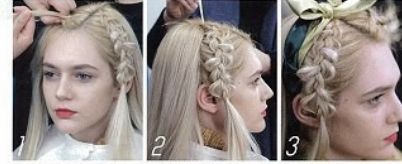
1 두 가닥의 머리카락으로 시작, 2 머리카락을 대각선 교차해서 묶기, 3 헤어핀세서리 고정하기.

한번 디스코 머신과 불린 스타일로 두피를 따라 머리카락을 띠 울려 포개는 방법이다. 세 가닥의 기본 스타일과 두 가닥의 헤링본 또는 디스본 스타일이 대표적이 중에서도 헤링본 브레이드를 연출하는 방법은 다음과 같다. 가래머 정수리 부분의 머리카락을 조금씩 두 가닥으로 잡아 X자 형태로 겹친 상태에서 주변 머리카락과 합쳐가며 교차시키는 것. 가래머의 반대쪽까지 같은 방법으로 묶어 내린 후 헤어핀으로 고정하면 더욱 예쁘다. 후드 커디건, 벨벳스 일루어, 린폴 장식 나트 티셔츠, 오즈세진, 브레이슬릿과 같은 연출한 방울 밴드, 이즈노브로, 헤어핀드, 레너크리스.