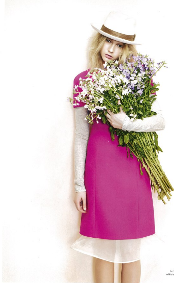
cotton top by JOSEPH hot pink dress by MICHAEL KORS white tulle skirt by EMPORIO ARMANI fedora by HERMES