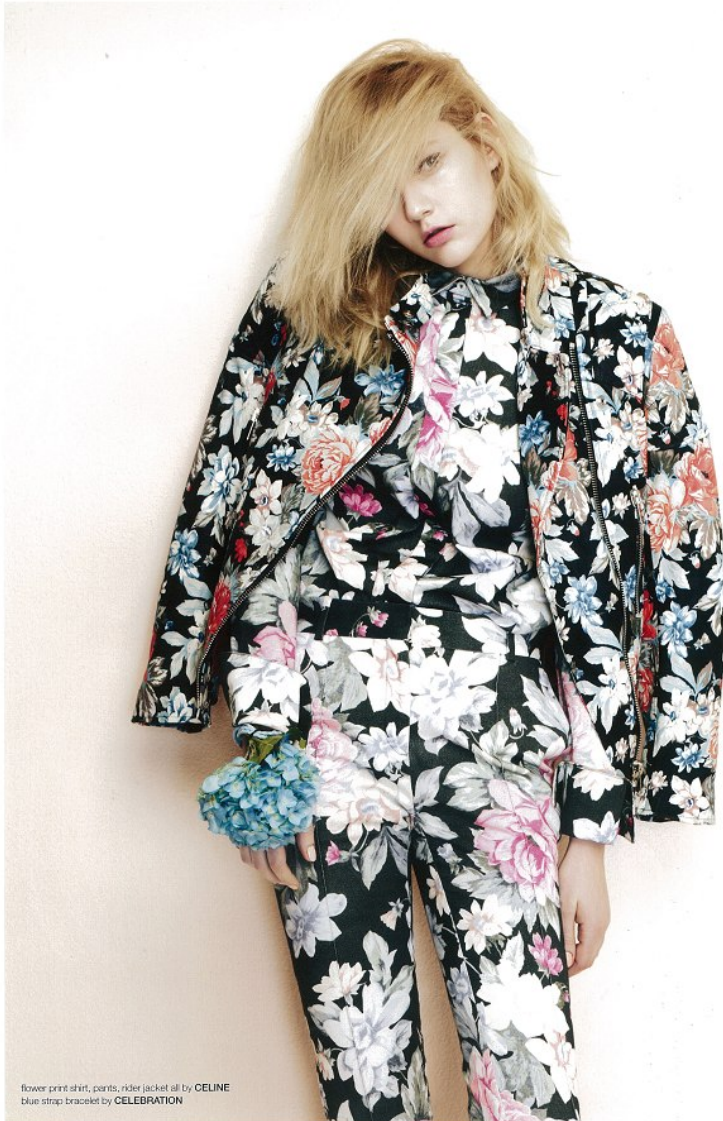
flower print shirt, pants, rider jacket all by CELINE blue strap bracelet by CELEBRATION

Morph Management, 36 Jangmun-ro Yongsan-gu Seoul Korea ZIP 04393 | Phone: +82 2 797 7200